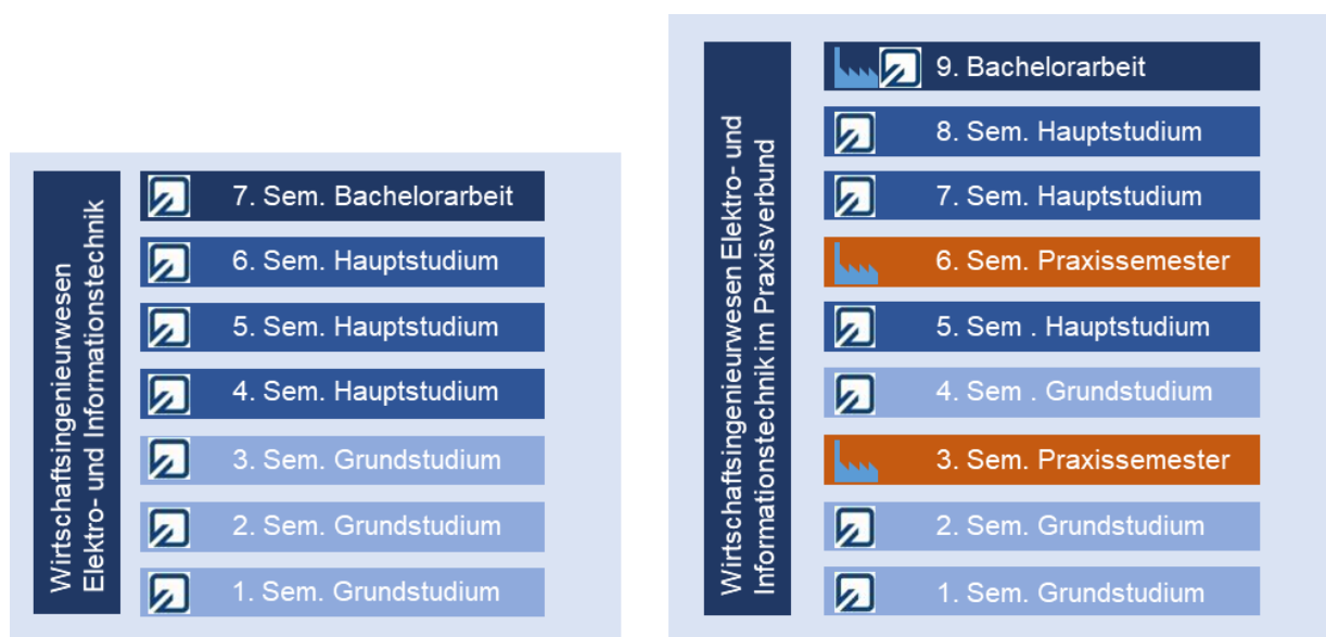
Abbildung 1: Aufbau der Studiengänge WEIT (links) und WEITiP (rechts; gültig für beide Varianten)

Insgesamt werden im Studium mindestens 210 ECTS-Leistungspunkte (LP bzw. Credit-Points) erworben, das sind pro Studiensemester im Schnitt 30 Leistungspunkte (LP).